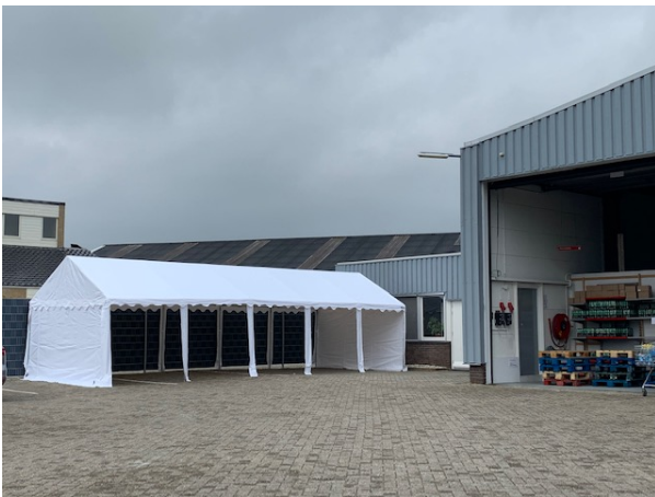
Tent op het terrein van de Voedselbank waar de klant de boodschappen kan inpakken.

De uitgiften zijn vanaf maart van het verslagjaar anders uitgevoerd. Namelijk met inachtneming van de voorschriften die er kwamen door de uitbraak van de corona. Ieder droeg mondkapjes, we houden de anderhalve meter aan, er gaan niet meer dan twee mensen tegelijk naar binnen, etc.etc. Daarnaast maken we niet meer gebruik van de kratten die de klant zelf uitpakt. Met een winkelwagentje loopt de klant langs de uitdeelpunten en ontvangt daar de eerder klaargezette pakketten in papieren en/of plastic zakken. Zodoende is de klant maar kort in het gebouw. Buiten is een tent geplaatst waarin de mogelijkheid is de goederen in eigen tassen over te pakken.