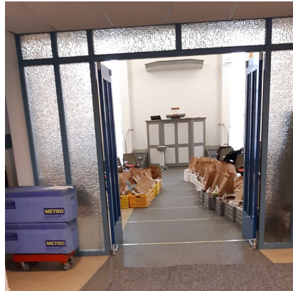
Uitgifte staat gereed in het kerkgebouw in Zuidbroek

In Zuidbroek werd eerst uitgegeven in het wijkcentrum De Broeckhof. Toen die in verband met de corona moest sluiten bood de GKv aan de Hoofdstraat hun kerkgebouw aan. Omdat het aantal klanten in Zuidbroek in een jaar behoorlijk toenam werd de, eveneens gratis ter beschikking gestelde, ruimte in De Broeckhof te klein, zodat besloten is definitief bij de GKv, met hun toestemming, gebruik te blijven maken.