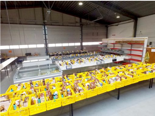
Uitgiftepunt Hoogezand, Productieweg

het grootste deel vanuit de vestiging aan de Kees de Haanstraat te Sappemeer, tot en met maart 2018 en daarna vanaf de nieuwe locatie Productieweg 1 te Hoogezand, de pakketten voor klanten van de gemeente Slochteren vanuit het jeugdhonk 't Schienvat achter de Geref. Kerk in Schildwolde.