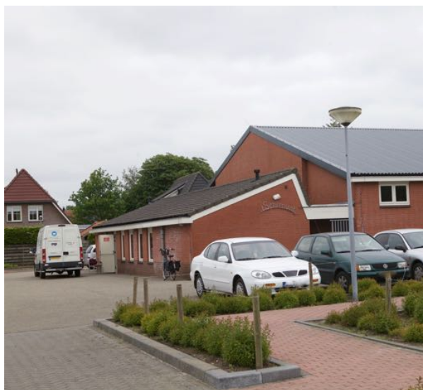
Uitgiftepunt 't Schienvat Schildwolde