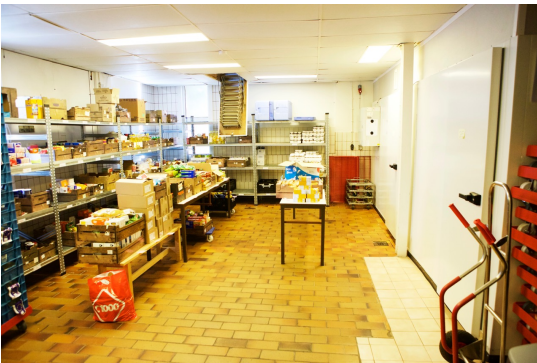
Uitgiftepunt Hoogezand, Kees de Haanstraat

De uitgifte van pakketten gebeurt hoofdzakelijk op vrijdag. Ook in 2017 gebeurde dat op twee locaties: het grootste deel vanuit de vestiging aan de Kees de Haanstraat te Sappemeer, en kleiner deel vanuit 'De Kandelaar' achter de Geref. Kerk in Schildwolde.