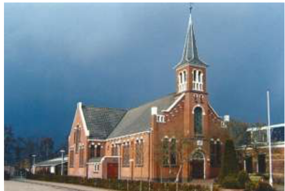
Uitgiftepunt Schildwolde, achter De Kandelaar